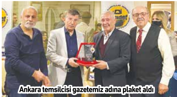
Ankara temsilcisi gazetemiz adına plaket aldı